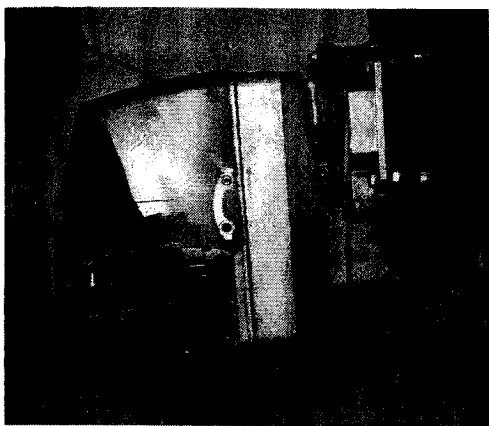
stavka 3. Uljni plamenik