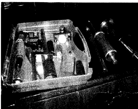
stavka 5. Uređaj s dodatnom opremom