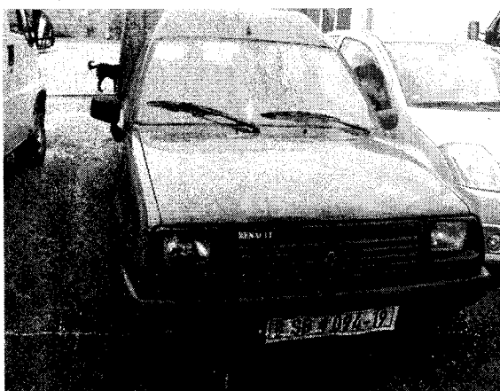
stavka 6. Automobil Renault