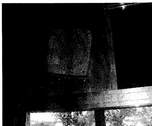
stavka 4. Oprema za grijanje i ventilaciju