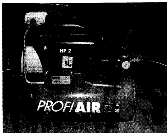
stavka 7. Kompresor